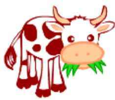
It's a cow.