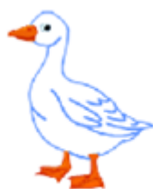
It's a goose.