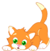
It's a cat.