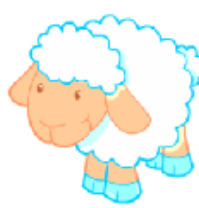
It's a sheep.