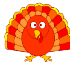
It's a turkey.