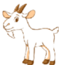
It's a goat.