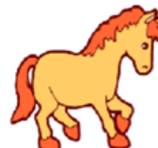
It's a horse.