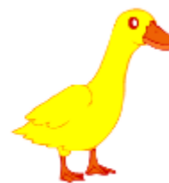
It's a duck.