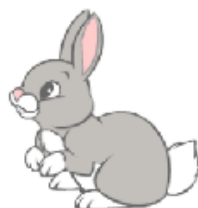
It's a rabbit.