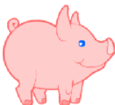
It's a pig.