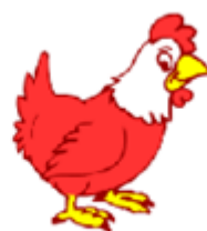
It's a hen.