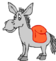
It's a donkey.